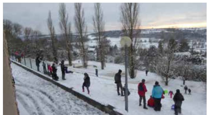
La neige a aussi ses bons côtés !