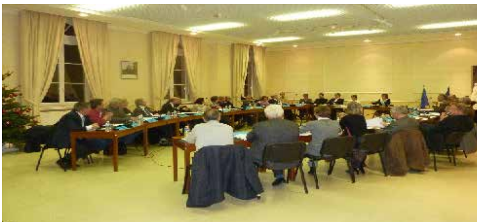
1 er conseil communautaire Gally Mauldre : 8 janvier 2013 à la mairie de Saint-Nom-La-Bretèche